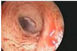
Frau hatte lebende Maden im Ohr