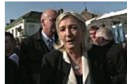
Rechtsextreme kämpfen um Frank...