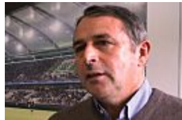
Allofs zum FCB: "Die anderen werd...